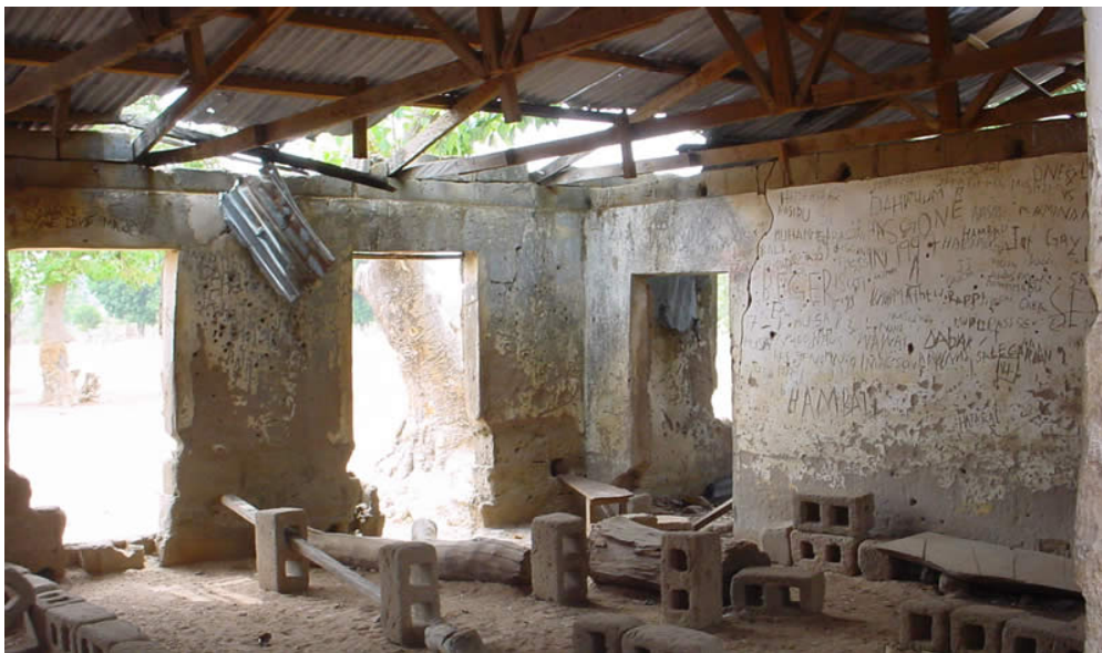
Figuur 3: het te renoveren schoolgebouw

De renovatie van het schoolgebouw wordt uitgevoerd door een lokaal bouwbedrijf die wordt geselecteerd door onze partnerorganisatie EFLI. Het bouwbedrijf zal zich zoveel mogelijk beperken tot de supervisie, planning en organisatie van de bouw. Verder wordt zoveel mogelijk gebruik gemaakt van lokale werknemers om de kosten te beperken en de betrokkenheid van de bevolking te verhogen.