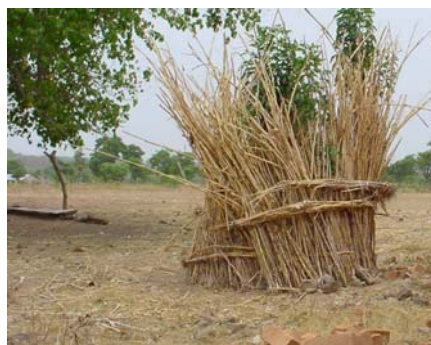
Figuur 2: de huidige sanitaire voorziening van de school

Omdat er onvoldoende klaslokalen beschikbaar zijn krijgen de leerlingen les op stukken boomstammen of blijven staan. Bij mooi weer krijgen de leerlingen buiten les onder een boom, zodat ze in de schaduw zitten.