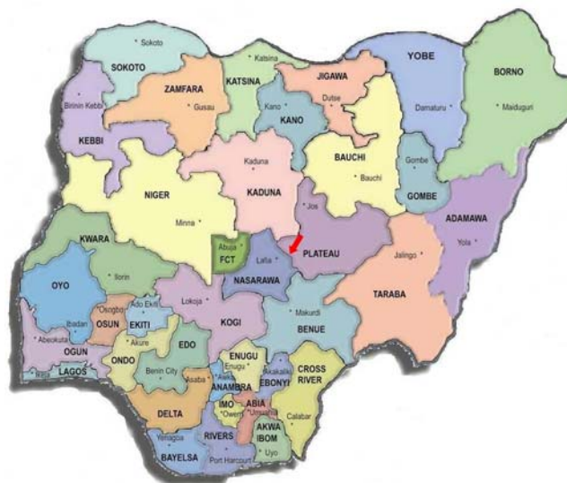
Figuur 1: kaart van Nigeria waarbij Namu wordt aangegeven met de rode pijl

De laatste jaren verliezen de boeren in Namu steeds meer van hun gewassen. Daarnaast haalt men op dit moment niet meer dan 50% rendement uit het land. Wat hier exact de oorzaak van is, is niet duidelijk. Duidelijk is wel, dat boeren en ouderen dolgraag praktijkonderwijs zouden willen volgen, voornamelijk gericht op de werkzaamheden en om het rendement van de landbouw kunnen vergroten.